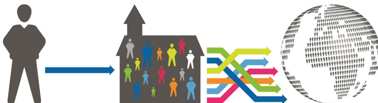
Abb. 1: Unser Traum: Die Erneuerung von Menschen, Kirchen und der Gesellschaft

IGW hat sich von jeher zu einer engen Zusammenarbeit mit lokalen Kirchen und Werken verpflichtet. Als Partner bilden wir (zukünftige) Leiterinnen und Leiter aus und weiter, die das Evangelium leben und so Kirche und Gesellschaft erneuern. Dabei erwarten wir, dass Gottes Reich auf dieser Welt sichtbar wird – in veränderten Menschen, in veränderten Kirchen sowie darüber hinaus in einer veränderten Gesellschaft.