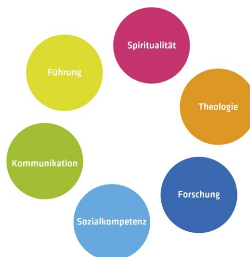
Abb. 3: Die sechs entscheidenden Kompetenzen und Aus- und Weiterbildungsinhalte von IGW

IGW bildet konsequent kompetenzorientiert aus. Kompetenzen sind erlernbare Fähigkeiten, die dazu dienen, Herausforderungen erfolgreich meistern zu können. Wir haben uns gefragt: «Über welche Kompetenzen sollten unsere Absolventen und Absolventinnen, um in den nächsten Jahren erfolgreich Gottes Reich zu bauen?» Das Ergebnis: IGW bildet verantwortliche Leiter und Leiterinnen in sechs entscheidenden Kompetenzen aus (siehe nebenstehende Grafik). Dabei spielen Kommunikation und Führung sowie auch Spiritualität und Selbstkompetenz (im Gegensatz zu anderen Aus- und Weiterbildungsangeboten) neben Theologie und Forschung eine sehr wichtige Rolle.